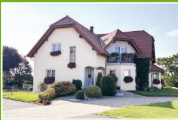
4 rue de Hoffen - Hohwiller