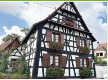
12 rue du Frohnacker - Sultz-sous-Forêts