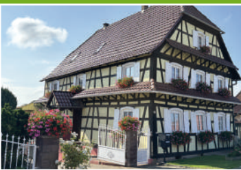
37 rue Principale - Hohwiller