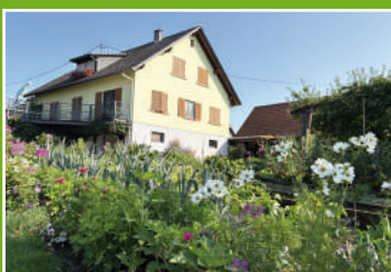
6 rue de Hoffen - Hohwiller