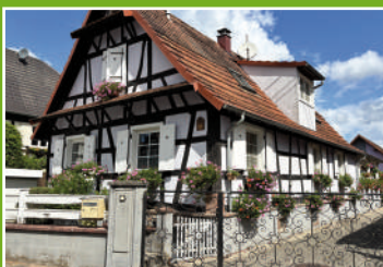
12 rue de Pechelbronn - Sultz-sous-Forêts