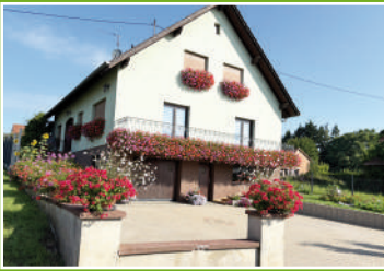
18 rue de Reimerswier - Hohwiller