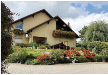
51 rue de Lobsann - Sultz-sous-Forêts