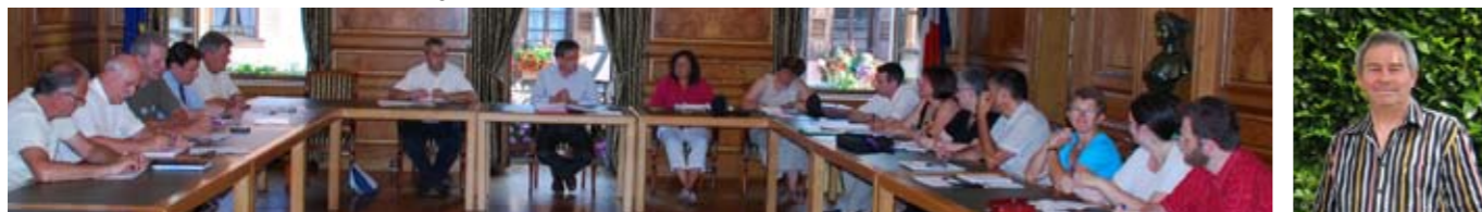
Conseil Municipal 2008 Maire - Délégué de Hohwiller

Maire 1 ère Adjointe au Maire chargée des projets, des travaux et de l'urbanisme 2 ème Adjoint au Maire chargé des finances et du développement économique 3 ème Adjointe au Maire chargée de la culture, du logement, de l'action sociale, des écoles et des personnes âgées 4 ème Adjoint au Maire chargé du sport et des associations Maire - délégué de Hohwiller